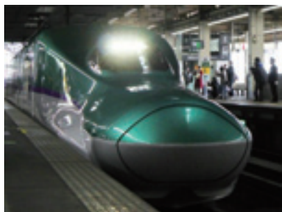
3月26日に開業した 北海道新幹線