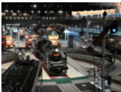
鉄道博物館

次年度には、区民アンケート等による外部評価、検証を行い、区の個性を生かしたまちづくりを推進していきます。