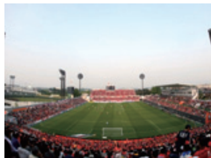
NACK5スタジアム大宮