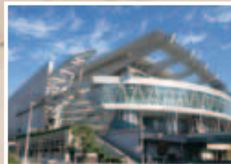
さいたまスーパーアリーナ

2020 東京オリンピック・パラリンピック競技大会では、市内を会場に「さいたまスーパーアリーナ」(中央区)でバスケットボール、「埼玉スタジアム2002」(緑区)でサッカー競技の開催が予定されています。