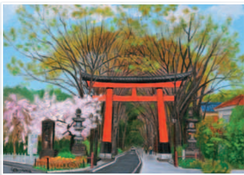
▲秋山静子作「一の鳥居」2007 (大宮二十景絵葉書冊子より)

※大宮二十景絵葉書冊子 (20種類を1冊に・価格300円) は 各区情報公開コーナーにて販売しています。