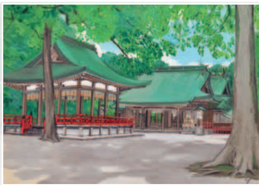
▲秋山静子作「氷川神社社殿」1985 (大宮二十景絵葉書冊子より)

※大宮二十景絵葉書冊子 (20種類を1冊に・価格300円) は 各区情報公開コーナーにて販売しています。