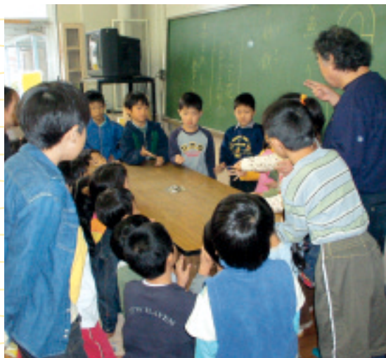
「どうしてかな？」 理科実験から