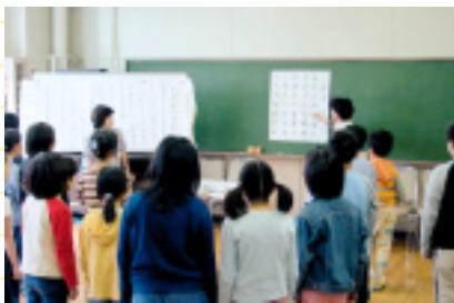
「大きな声で！」 朗読暗唱から

区役所、公民館、NPO（特定非営利活動法人）、市民からなる推進協議会をつくります。申込みは公民館で行い、講座の運営（内容・先生の派遣等）は推進協議会が行います。