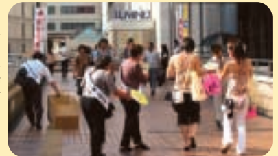
街頭キャンペーン

本会は大宮警察署と連携し、街頭補導や風俗環境の浄化等を行い、青少年の非行防止と健全育成に努め、社会の健全な発展に寄与するために活動しています。メンバーは29名、月3回大宮駅周辺で、街頭補導や少年への声かけなどを実施しています。非行に走ったり犯罪の被害に遭う少年が、この大宮から1人でも少なくなるように、私達は願っています。