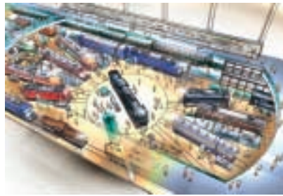
歴史ゾーンイメージ

鉄道博物館は都内にある交通博物館を移転し、鉄道を展示の中心として建設されます。鉄道の歴史・資料の保存、鉄道文化の継承などを目的として、実物車両の公開や日本最大級の鉄道模型ゾーンが設置され、その展示スペースは約9,600m 2 にも及