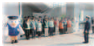
5月10日に実施した サイクルマナーアップキャンペーン