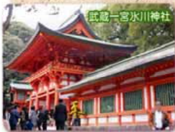
武蔵一宮氷川神社