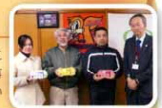
区の花オリジナルナンバープレート交付初日に

昨年3月11日に起きた東日本大震災から1年が経ちました。この震災を通して改めて普段の備えの大切さを痛感いたしました。区では現在、区役所の耐震調査を行っており、引き続き庁舎の安全確保に努めてまいります。被災地の1日も早い復興をお祈りしております。