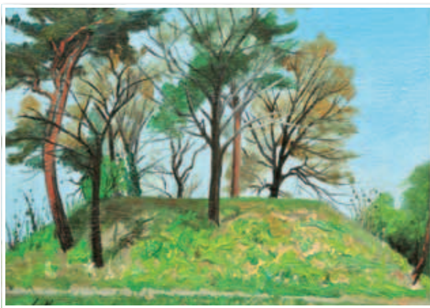
▲秋山静子作『茶臼塚古墳』1997 (大宮二十景絵葉書冊子より)

※大宮二十景絵葉書冊子 (20種類を1冊に・価格300円) は 各区情報公開コーナーにて販売しています。