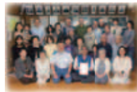
▲5月30日(木) 住宅防火モデル地区指定書交付式

地域の協力を得ながら消防機関による集中的かつ効果的な防火対策を展開し、住宅火災による死傷者の減少及び被害の軽減、並びに市民に対する防火意識の高揚を図ることを目的に、各区1自治会を指定し様々な取り組みを展開していきます。