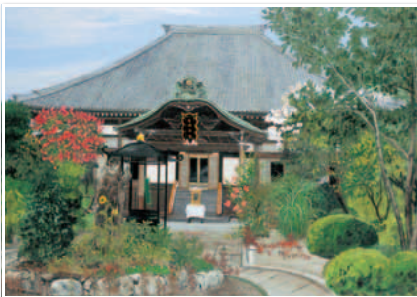
▲秋山静子作「普門院」2007 (大宮二十景絵葉書冊子より)

※大宮二十景絵葉書冊子 (20種類を1冊に・価格300円) は 各区情報公開コーナーにて販売しています。