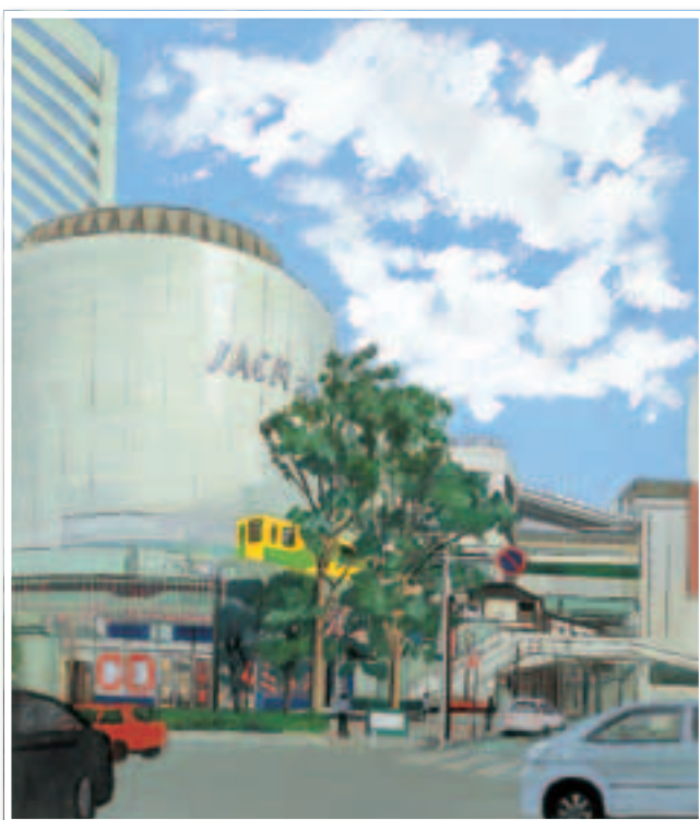
▲秋山静子作『ニューシャトルとJACK大宮』1994 (大宮二十景絵葉書冊子より)