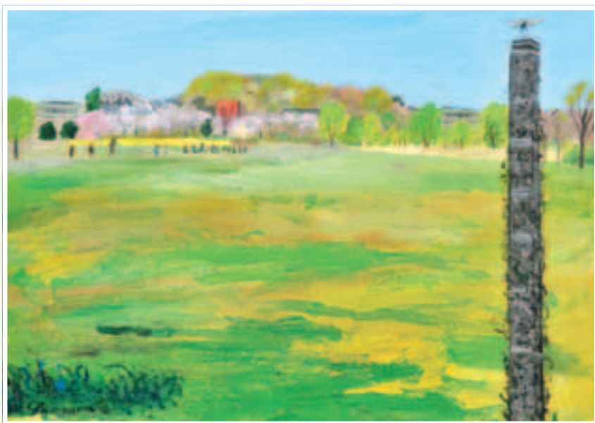
▲秋山静子作「大宮第三公園」2007 (大宮二十景絵葉書冊子より)

※大宮二十景絵葉書冊子 (20種類を1冊に・価格300円) は 各区情報公開コーナーにて販売しています。