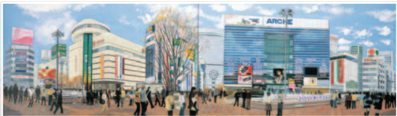
▲秋山静子作「西口の賑わい」2007 (大宮二十景絵葉書冊子より)