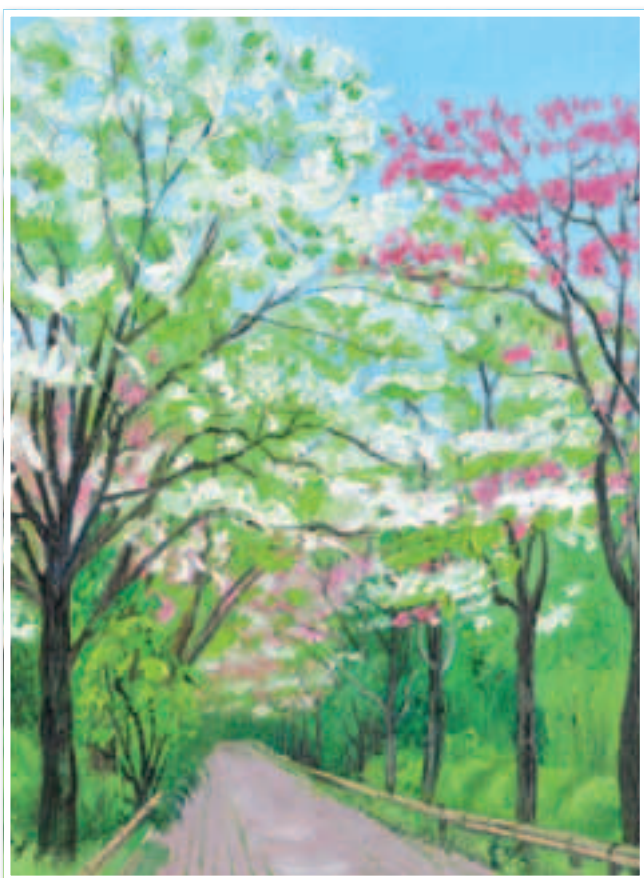
▲秋山静子作「ハナミズキ」2007 (大宮二十景絵葉書冊子より)