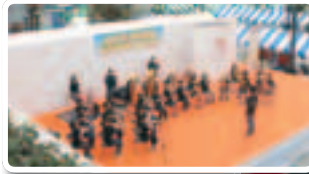
◀区民ふれあいフェア