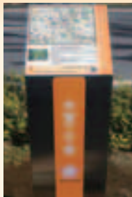
※場所により案内板は異なります。