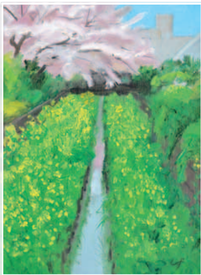
▲秋山静子作「切敷川」2007 (大宮二十景絵葉書冊子より)