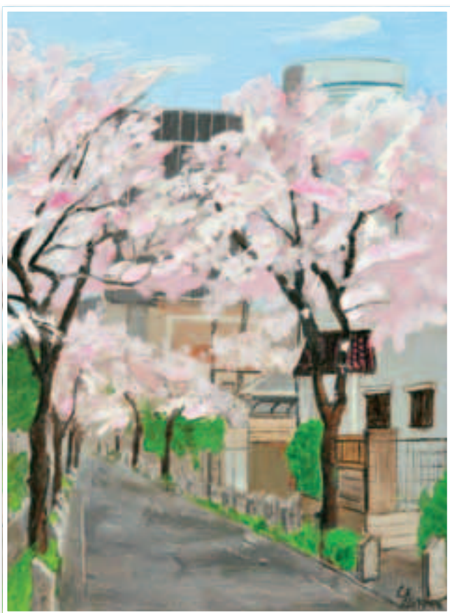
▲秋山静子作「さくら並木通り」2008 (大宮二十景絵葉書冊子より)