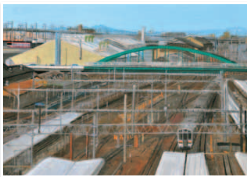
▲秋山静子作「大栄橋」2009 (大宮二十景絵葉書冊子より)

※大宮二十景絵葉書冊子 (20種類を1冊に・価格300円) は 各区情報公開コーナーにて販売しています。