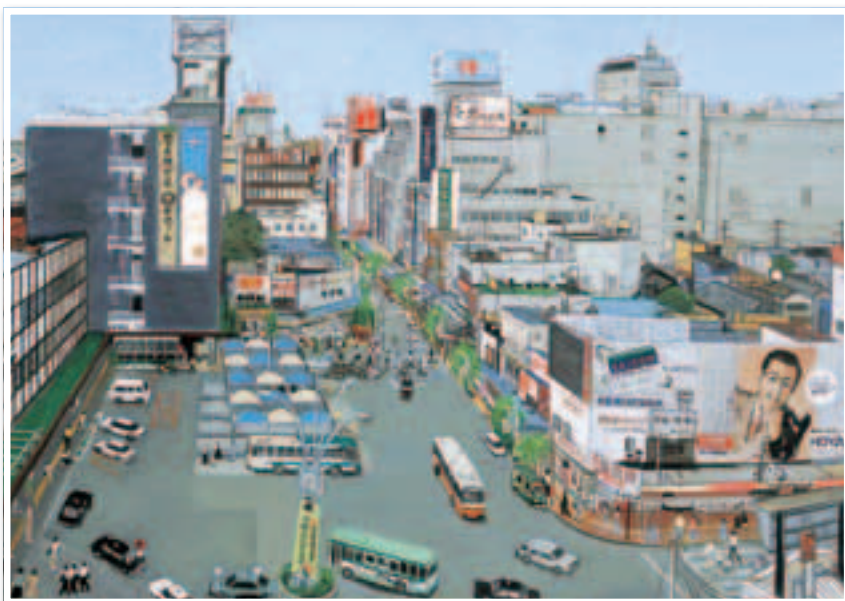
▲秋山静子作『東口駅前ロータリーI』1990 (大宮二十景絵葉書冊子より)

〒330-8501 大宮区大門町3-1 ☎657・0111 (代表) FAX 646・3160