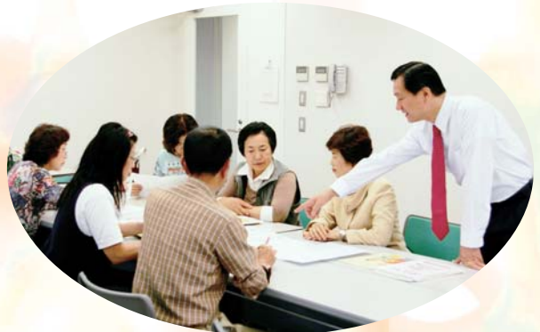
子育てマップ編集会議のようす

区の迅速な対応によりこの提案は事業化され、現在は、「子育てマップ編集会議(主任児童委員・区民会議委員・区福祉課で構成)による編集作業が、着々と進行しています。