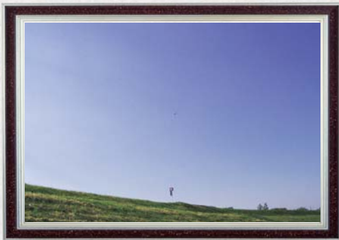
【応募例】澄みわたる荒川の空（西遊馬）