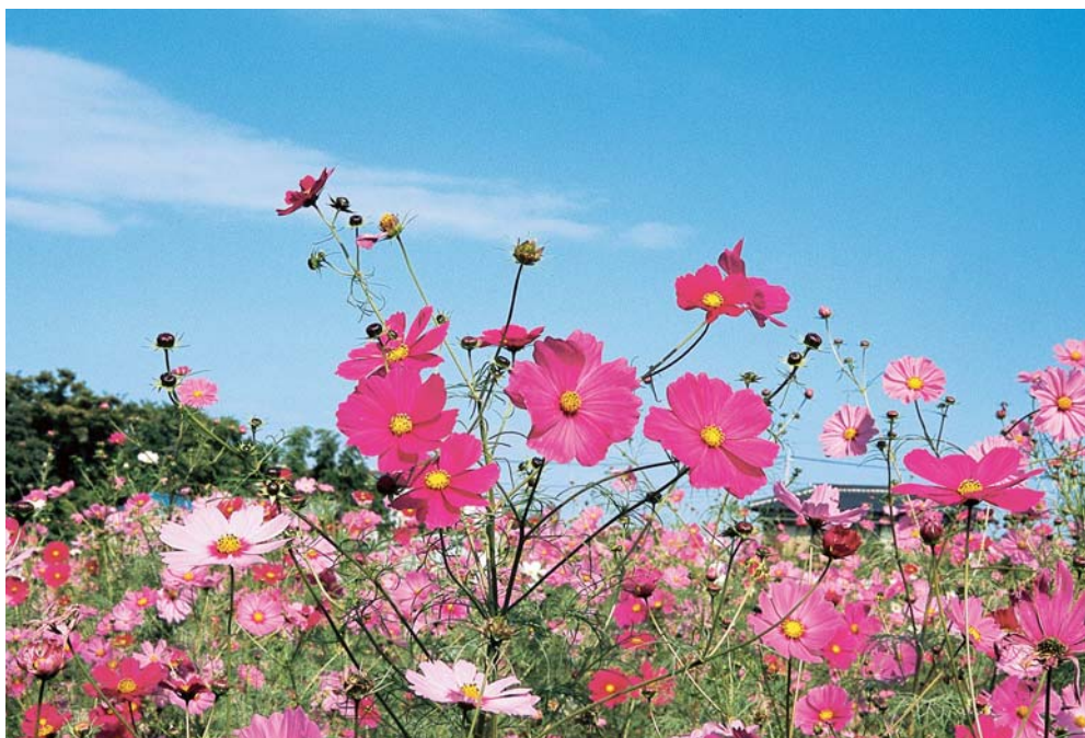
花の丘のコスモス畑（西新井）