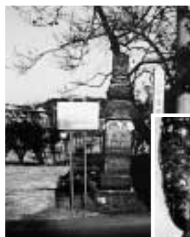
辻の庚申塔 (市指定文化財)