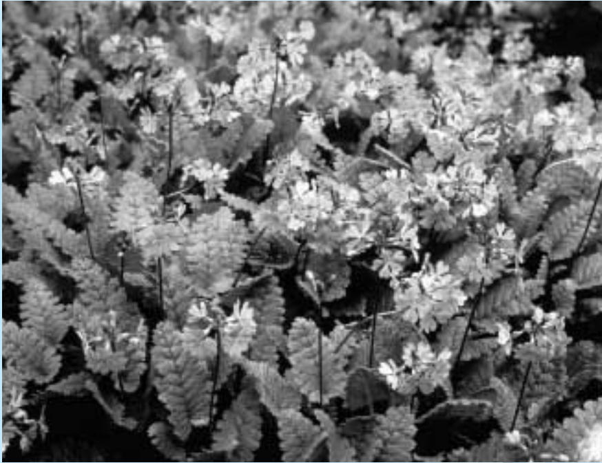
○錦乃原のサクラソウ

発行年月／平成18年3月 発行／さいたま市西区区民会議 事務局／さいたま市西区役所コミュニティ課