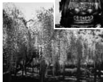
木造地藏菩薩坐像 (県指定文化財)