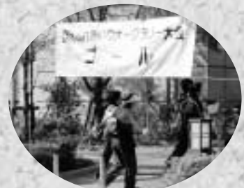
○ゴール! (馬宮コミュニティセンターにて)