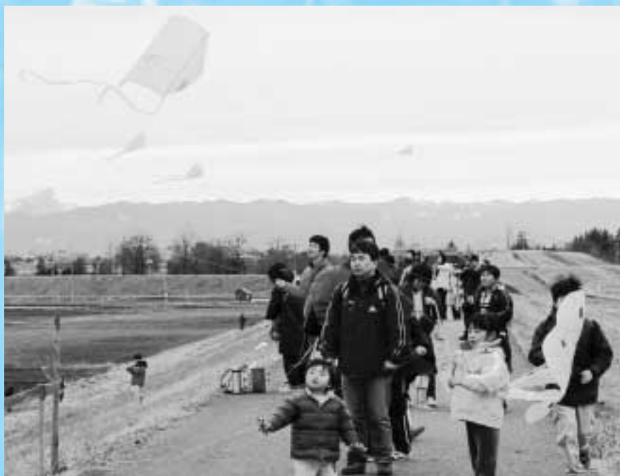
○荒川堤から秩父連山を臨む

発行年月／平成18年1月 発行／さいたま市西区区民会議 事務局／さいたま市西区役所コミュニティ課