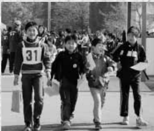
○いざ、スタート (馬宮東小学校にて)

なお、今年度は馬宮地区をゲレンデとして実施しましたが、来年度は植水地区をゲレンデとすることを検討していますので、皆さんお楽しみに!!