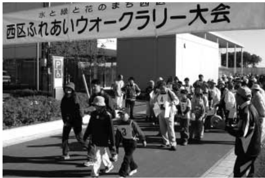
西区ふれあいウォークラリー大会のスタート風景（西区役所前にて）

発行年月/平成17年3月 発行/さいたま市西区区民会議 事務局/さいたま市西区役所コミュニティ課