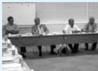
区民会議の会議風景（西区役所にて）

まず、基本になる3つの部会「都市基盤・交通部会」「健康・福祉部会」「文化・コミュニティ部会」を立ち上げ、各委員がそれぞれに所属しました。