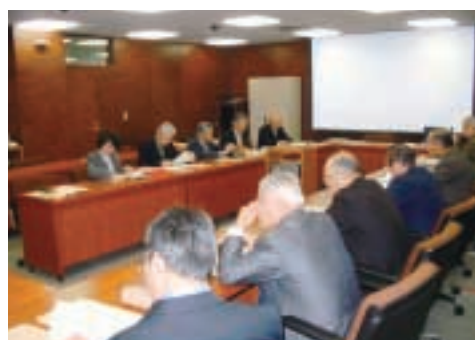
○先進事例視察（新宿区民会議）