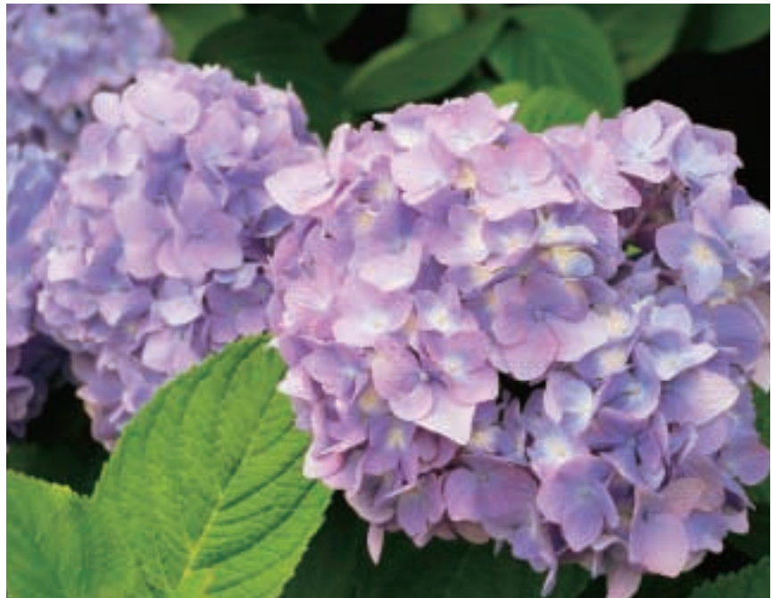
○八雲神社に咲く紫陽花