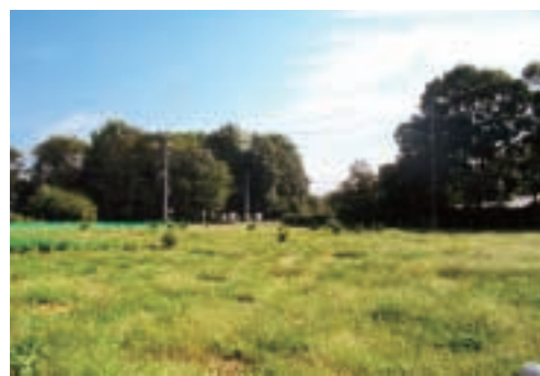
○イメージ (農地と屋敷林の風景)

区民の皆さんが日ごろ撮りためた「西区の自然」に関する写真をご応募頂き、区役所にパネル展示することを考えています。皆さんもカメラを片手に、西区の自然を探しに行きませんか？