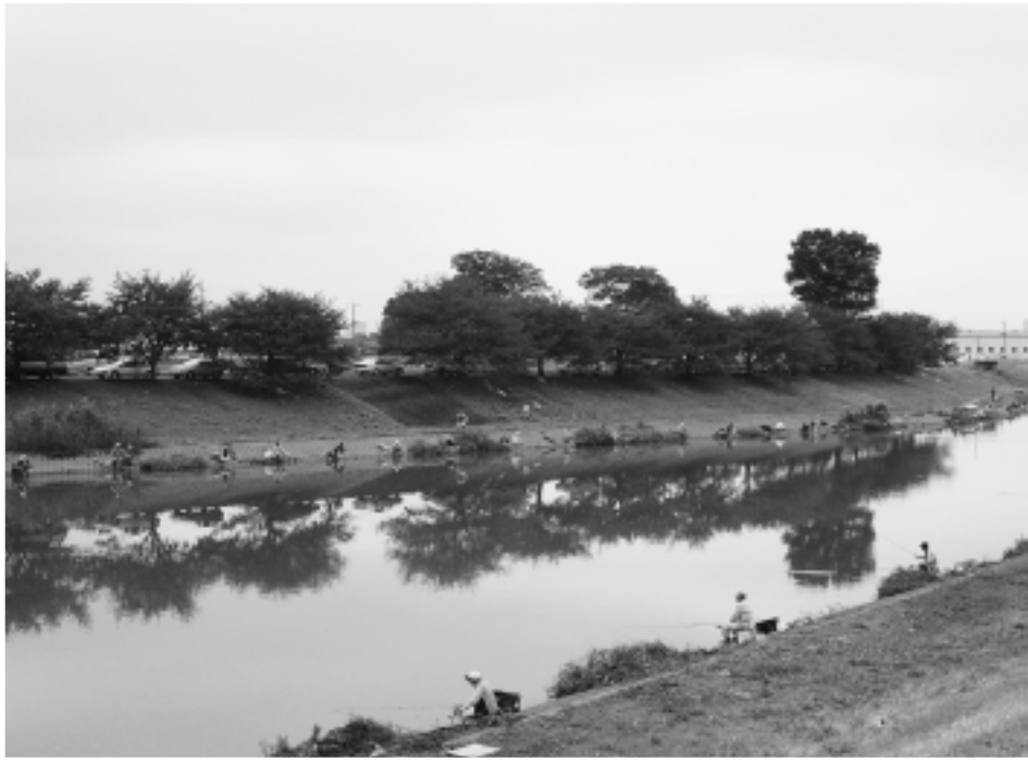
釣り人で賑わうびん沼川（馬宮地区塚本町）

発行年月／平成16年12月 発行／さいたま市西区区民会議 事務局／さいたま市西区役所コミュニティ課