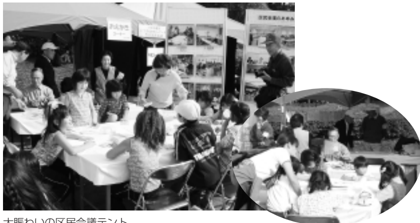
大賑わいの区民会議テント

11月6日(土)、晴天のもとで第2回「西区ふれあいまつり」が盛大に行われ、多くの区民の方で賑わいました。