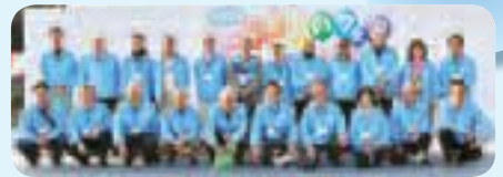
見沼区ふれあいフェアにて

のあるまちづくりを目指してまいりますので、温かいご支援・ご協力をお願いいたします。