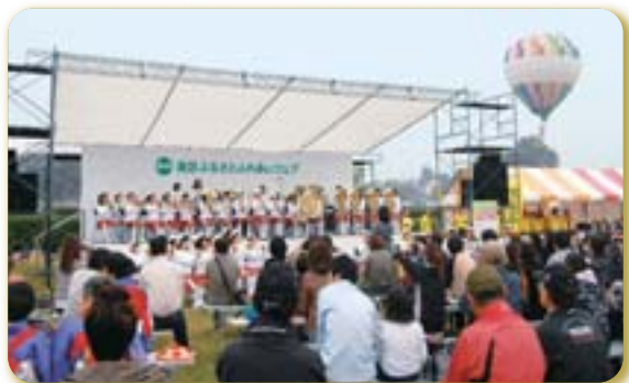
南区ふるさとふれあいフェア(浦和競馬場)

東西に長い区内の地域間交流に取り組み、ふるさとへの愛着と区民相互の融和を図るとともに、活発な地域コミュニティを醸成します。