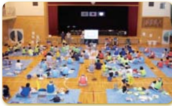
夜間避難場所運営訓練(大谷場東小学校)