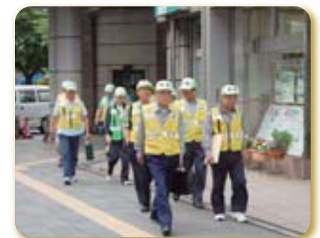
区内一斉防犯パトロール