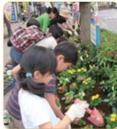
市民活動ネットワーク登録団体による花の苗の植え付け

区内の小中学校(20校)、保育園(8園)、幼稚園(13園)やボランティア団体などに、区の花「ヒマワリ」の苗や種を配布し、区の花の啓発を行うとともに、栽培を通して愛着や親しみを醸成します。 【継続】