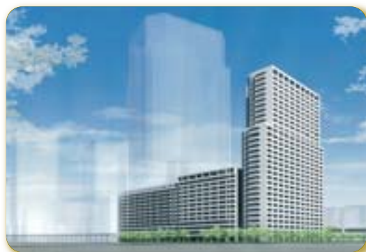
第3街区再開発事業完成予想イメージ図

多世代が個性豊かに暮らせる街を目指して、周辺環境と調和したまちづくりを図ります。(平成26年度完成予定)