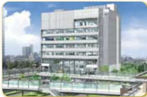
「サウスピア」概観イメージ図