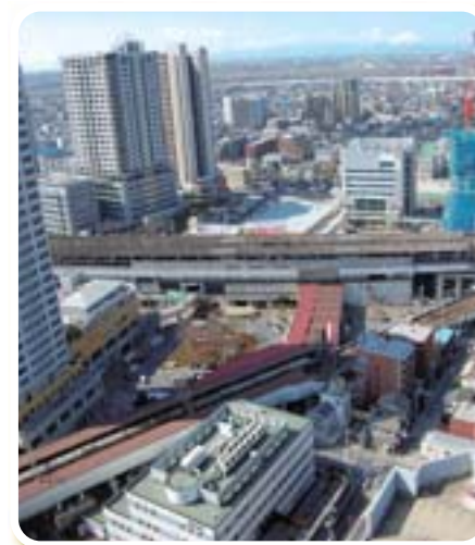
開発が進む武蔵浦和駅周辺地区