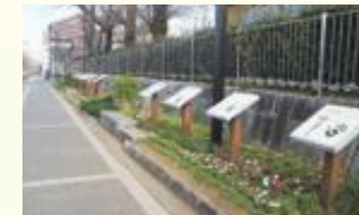
(手形レリーフの様子)

与野本町駅から芸術劇場を結ぶアートストリートエリア内に、俳優の「手形レリーフ」の設置や沿道の配電用地上機器にラッピング等を行うなど、「芸術のまち」としてのにぎわいを創出します。