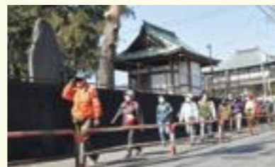
(ウォーキングの様子)

区民の健康と区内の魅力発見に役立てるためウォーキングコースの周知を図りウォーキングイベントを開催します。