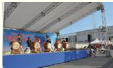
(区民まつりの様子)

区民や各団体の交流を通じてコミュニティの輪を広げるために、実行委員会との共催による「区民まつり」を開催します。