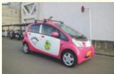
(青色防犯パトロールの様子)

障害のある方が差別や虐待とは無縁で、自分が望む暮らしができるまちづくりを目指し、障害福祉サービス事業所相互の情報交換を実施する連絡会及び専門家による研修会を開催します。