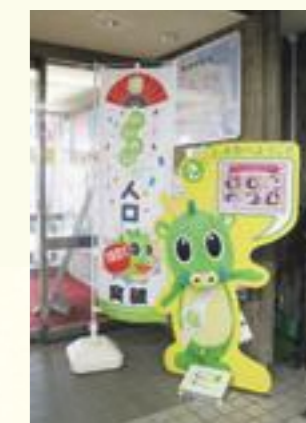
(写真サービス展示の様子)

保健センターを中央区役所別館に移転し、区役所機能を集約することで利用者の利便性の向上を図ります。