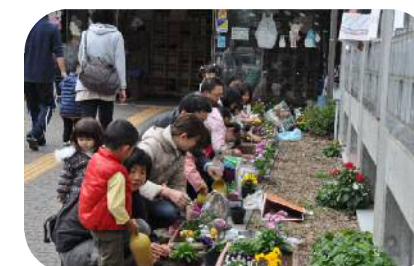
花と緑のまちづくり推進事業

…区民相互のふれあいや絆を深めるため、ボランティア団体等と協働して、駅・駅周辺や人の集まる場所を花や緑でいっぱいにする。