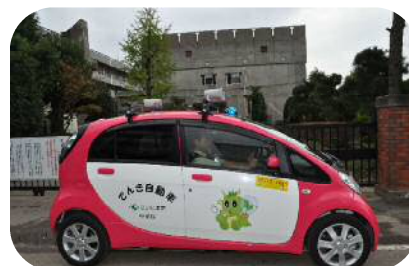
青色防犯パトロール実施事業