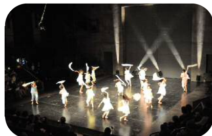
アートフェスタ支援事業

…アートストリート整備事業の一環として、さいたま芸術劇場出演者の手形とサインを設置します。