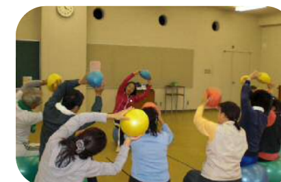
生活習慣病予防事業

…高齢者の健康維持を目的として「うんどう教室」を開催するとともに、自主活動を支援します。