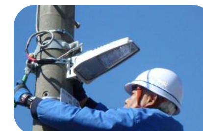
LED街路灯設置促進事業

…地球温暖化対策の一環として、夏場に庁舎外壁にアサガオを植栽し、緑のカーテンを作ります。従来の約2倍の横幅1.8mにします。