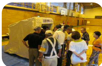
避難場所運営訓練事業

…電気自動車による青色防犯パトロールを週3回実施し、事件発生時の抑止に努めます。また、区内で事件等が発生した場合は、臨時パトロールを実施し、区民に更なる注意喚起を促します。