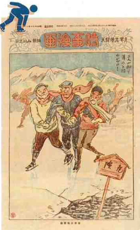
「三人四脚で薄氷を踏む思ひ！」