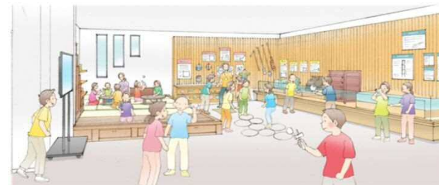
与野郷土資料館の内外イメージ