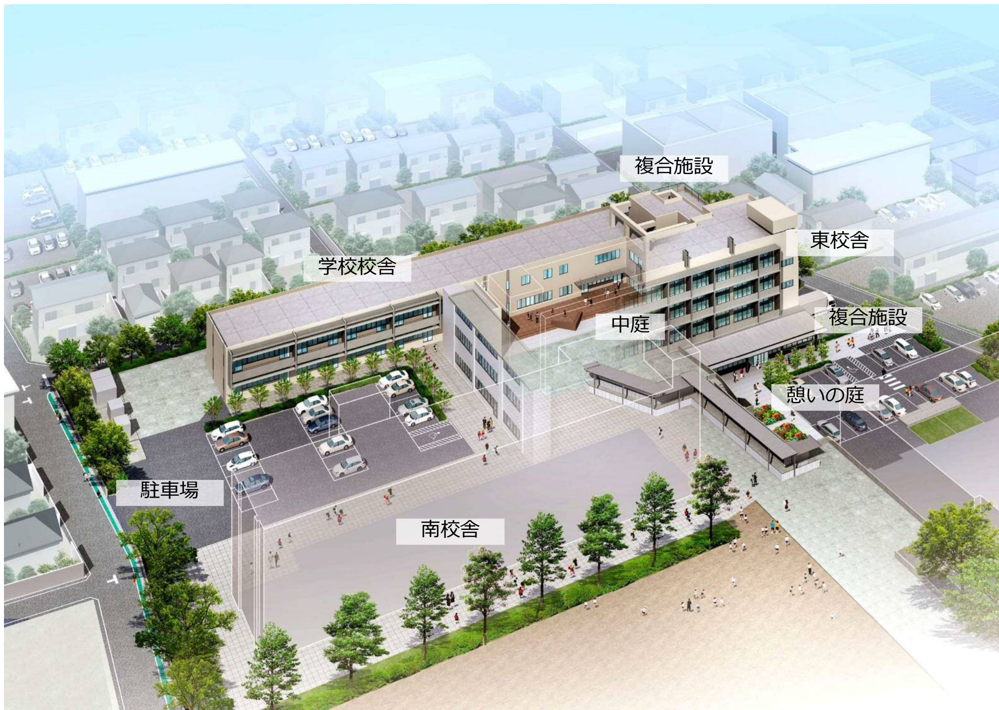
与野本町小学校複合施設 鳥瞰イメージ図