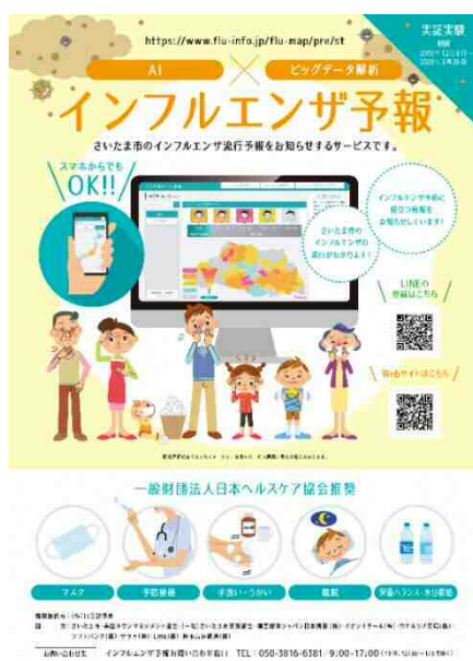
チラシ／ポスターイメージ

https://www.flu-info.jp/flu-map/pre/st （実証期間:2019年12月6日～2020年3月20日）