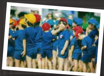
昨年度 優秀賞 「お父さん運動会をわけてくれたー」