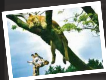
昨年度 優秀賞 「爆睡中」