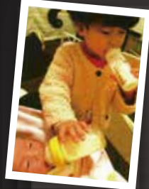
昨年度 優秀賞 「おいしいね〜」