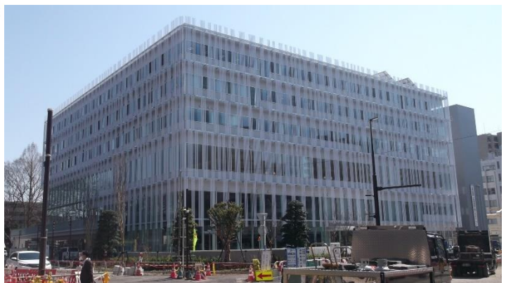
(平成31年3月20日 氷川緑道西通線側より撮影)