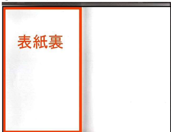
① 表紙裏 赤枠内が広告