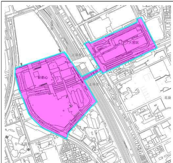
さいたま新都心駅周辺（案）