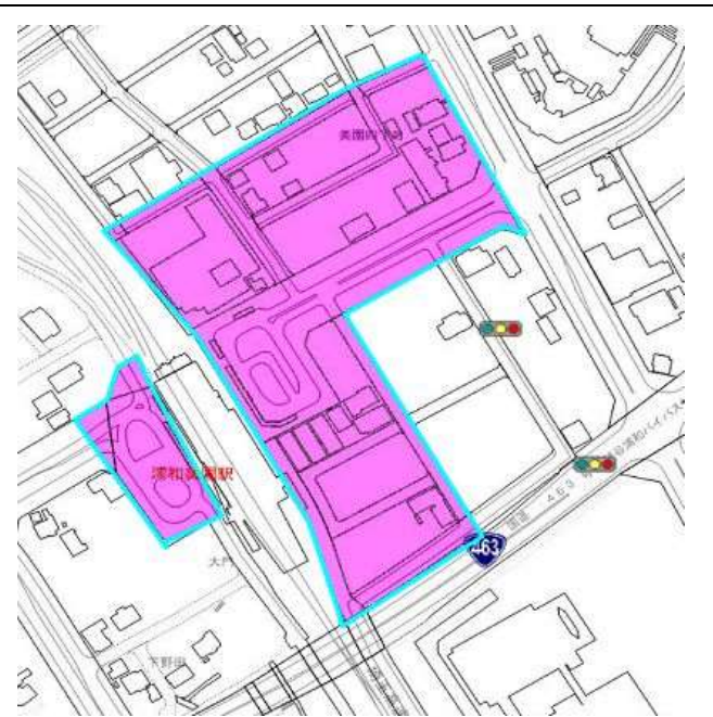
浦和美園駅周辺（案）