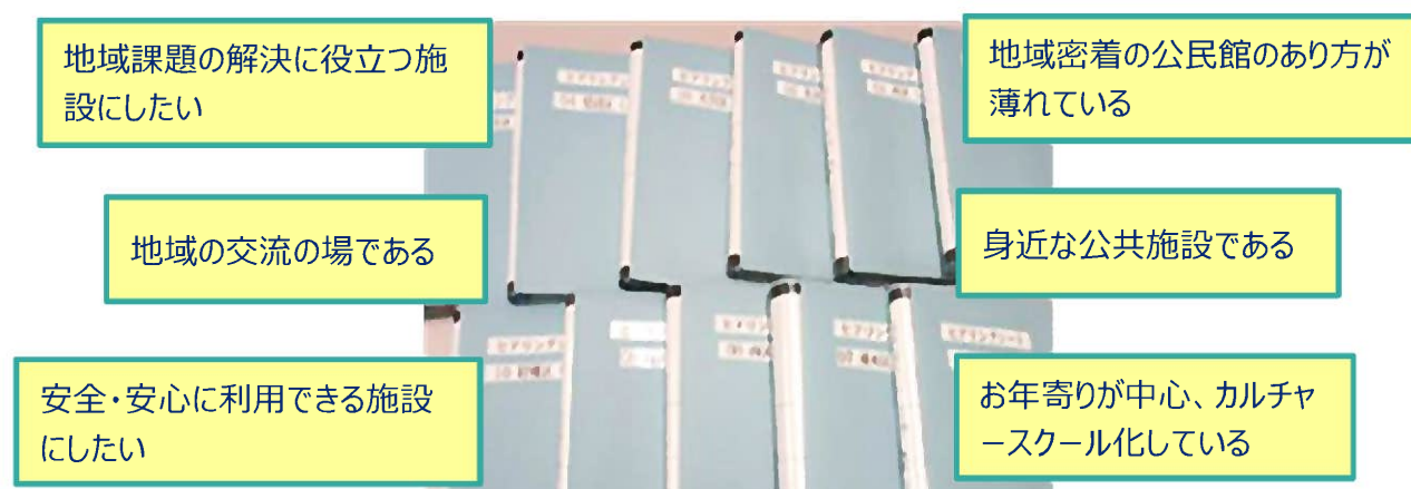
▲ヒアリングシート（写真1）

全ての公民館職員から、各公民館の現状や公民館職員の役割、望ましい公民館像や生涯学習のあり方についての意見を収集することが重要と考え、全公民館職員約280人を対象としたヒアリングシート（写真1）による意見聴取を実施しました。