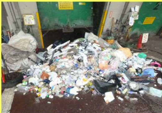
回収ごみの焼損状況

荷箱内から煙が見えたことから、塵芥車を安全な場所に移動させ、回収ごみを排出し、車載してある消火器具で初期消火をしています。