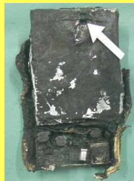
焼損したプレーヤー