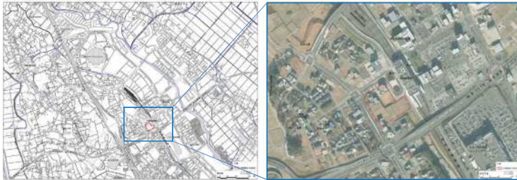
■浦和美園駅周辺航空写真