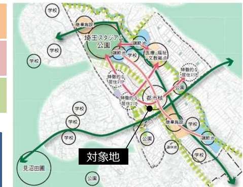
▼都市デザイン方針図