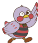
埼玉県のマスコット 「ざいたまっち」