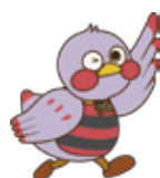
埼玉県のマスコット 「さいたまっちゃん」